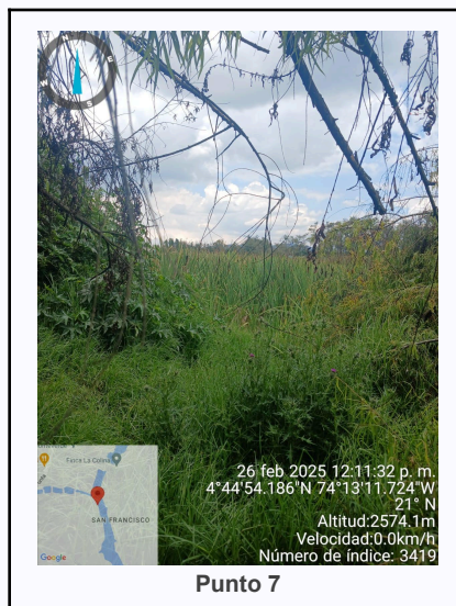
Ilustración 2. Fotos de los puntos del Recorrido de Control Y Vigilancia Ronda Del Humedal Gualí.

C.P 250020 Tel. (601) 8234070 823 40 71 / 823 40 73 Fax. (601) 8257620 Dir. Cra. 14 No. 13-05 03-FR-17 VER.10.2024